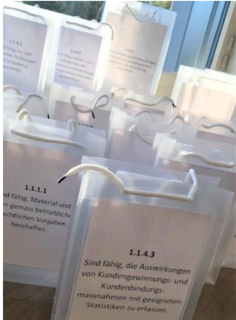
Alle Pflicht- und Wahlpflichtziele für die Ausbildung im Betrieb. Dank an üK-Leiterin Christin Keller, 2021.

Sichern Sie sich Ihren Platz am 30.11.2021