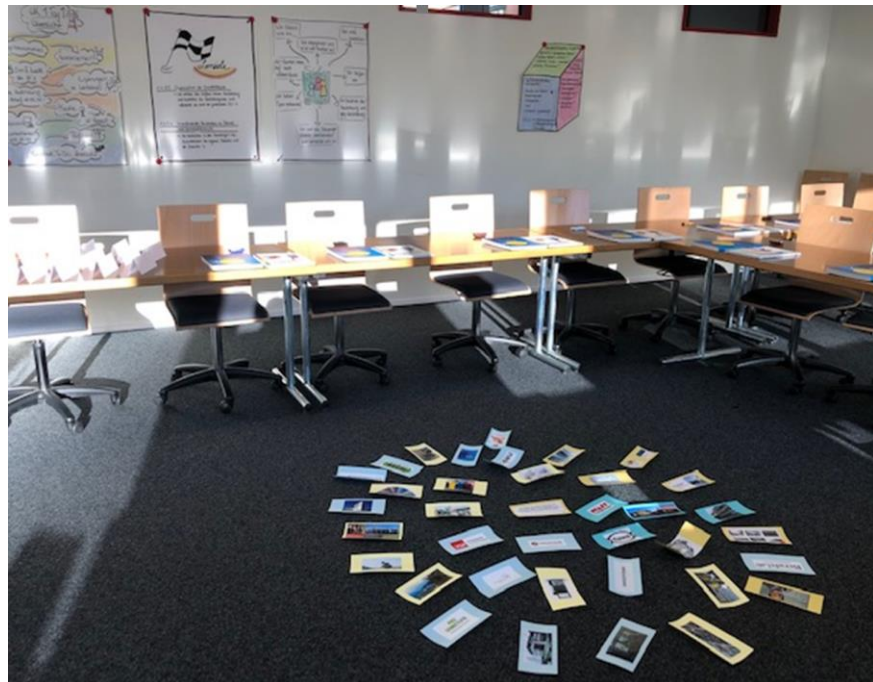
Herzlichen Dank an üK-Leiterin Christin Keller, 2021

Ein üK-Tag für Lernende: Abwechslungsreich, bunt und sehr intensiv